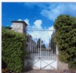
Yvelines MAGNY-LES-HAMEAUX Maison des Bonheur Etude Documentaire REPERAGE PHOTOGRAPHIQUE