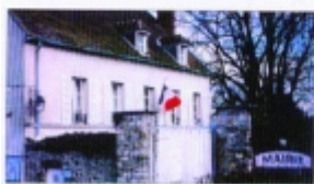
Yvelines MAGNY-LES-HAMEAUX Maison des Bonheur Etude Documentaire REPERAGE PHOTOGRAPHIQUE